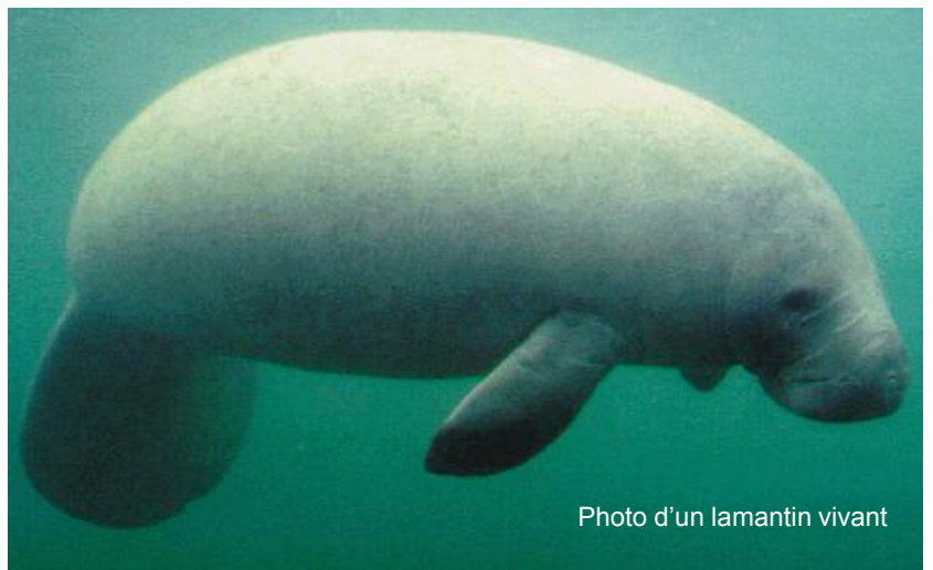
Photo d'un lamantin vivant

L'exemplaire fossile du Muséum pourrait-il être l'ancêtre commun aux Lamantins et aux Dugongs ? Oui – Non