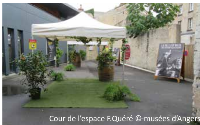
Cour de l'espace F. Quéré

Photographie professionnelle, tournages de films, court-métrages, enregistrement et captation sont soumis à l'autorisation de la direction.