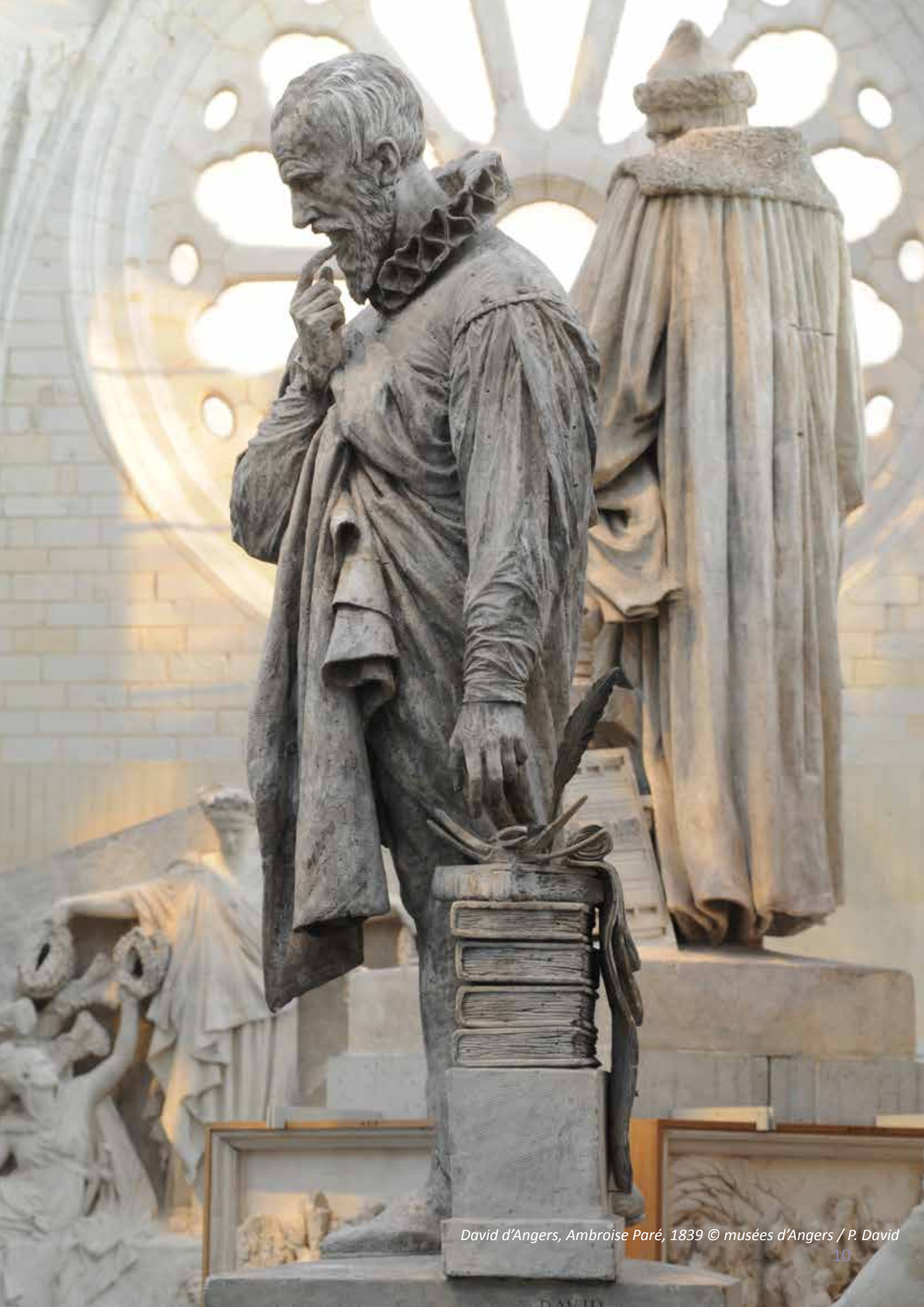
David d'Angers, Ambroise Paré, 1839