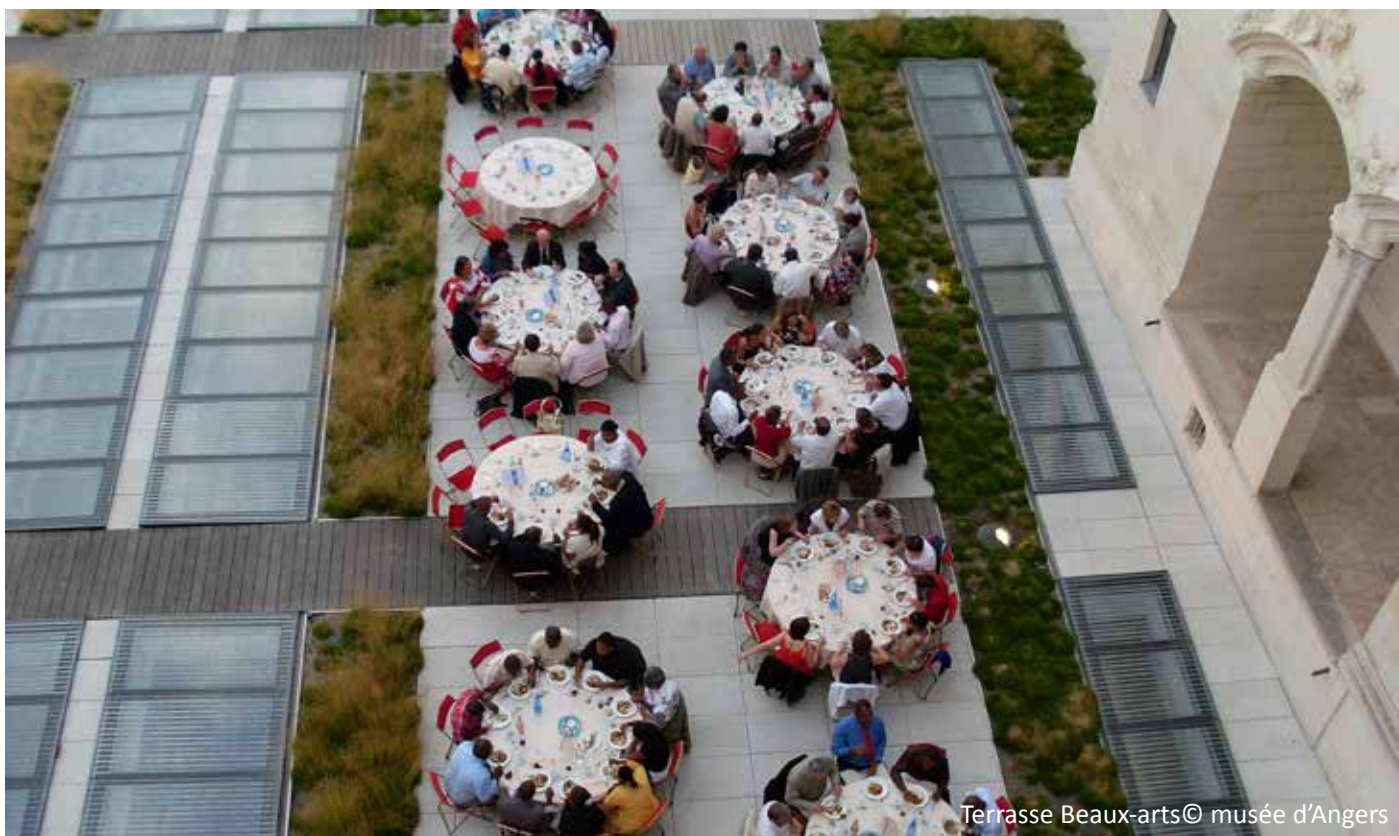
Terrasse Beaux-arts