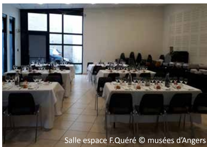
Salle espace F. Quéré

A deux pas du musée, pour vos déjeuners ou ateliers liés à l'auditorium, du lundi matin au vendredi midi, possibilité d'utilisation de cet espace. La salle sera mise à disposition en autonomie sous condition de location de l'auditorium (95 personnes assises).