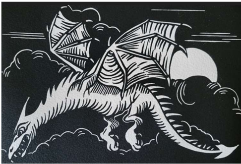
LINOGRAVURE DE FEROCÉ AILE

Mots-clés : Classification/géographie/géologie/biodiversité/bestiaire, merveilleux, muséum, cabinet de curiosité, arts et sciences, réalité/fiction