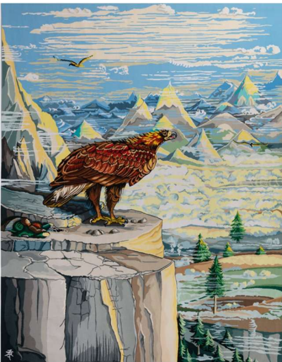
BILBO WOKE UP WITH THE EARLY SUN IN HIS EYES D'APRES UNE ILLUSTRATION ORIGINALE DE J. R. R. TOLKIEN POUR THE HOBBIT, 1937 © THE TOLKIEN ESTATE LIMITED 1937 TISSAGE ATELIER FRANÇOISE VERNAUDON, NOUZERINES ; COLLECTION DE LA CITE INTERNATIONALE DE LA TAPISSERIE, AUBUSSON

Dans l'œuvre littéraire de J.R.R Tolkien, la figure du héros se drape de sa propre complexité. Tolkien refuse le manichéisme entre le Bien et le Mal, tout est toujours en nuance. Plusieurs personnages endossent la parure de héros. Mais, tous sont tentés par une chose mauvaise qu'ils ont en eux, et à laquelle ils succombent ou non : ils ont tous leurs libres arbitres, loin d'être régis contre leur volonté par un destin pré-écrit. Tolkien tient à laisser le choix au lecteur quant à l'interprétation de l'influence du pouvoir sur tous les êtres humains. Son œuvre doit être une incitation à l'action et à la réflexion, et non l'affirmation d'une vérité préconçue.