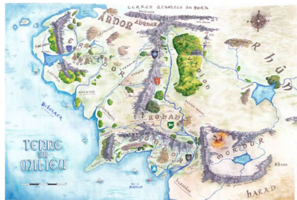
CARTE DE LA TERRE DU MILIEU, VALENTIN PASQUIER, 2025

© THE TOLKIEN ESTATE LTD & WILLIAMS COLLEGE OXFORD PROGRAMME TISSAGE ATELIER TAPISSERIE GUILLOT AUBUSSON COLLECTION DE LA CITE INTERNATIONALE DE LA TAPISSERIE, AUBUSSON