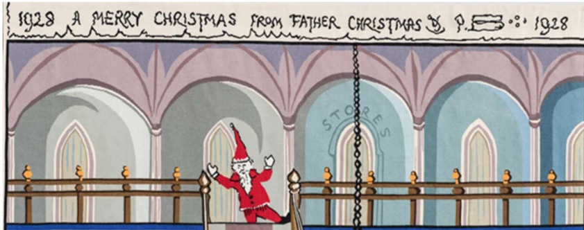
DETAIL, CHRISTMAS 1928

D'APRES UNE ILLUSTRATION ORIGINALE DE J. R. R. TOLKIEN POUR LETTERS FROM FATHER CHRISTMAS, 1928 © THE TOLKIEN ESTATE LTD, 1976