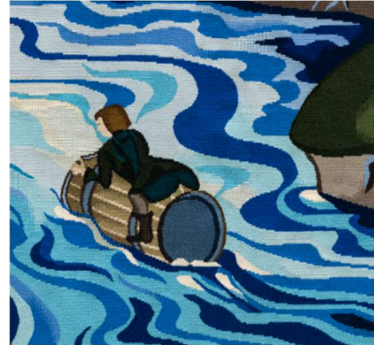
BILBO COMES TO THE HUTS OF THE RAFT-ELVES

D'APRES UNE ILLUSTRATION ORIGINALE DE J. R. R. TOLKIEN POUR THE HOBBIT, 1937 © THE TOLKIEN ESTATE LIMITED 1937 DELPHINE MANGERET ; COLLECTION DE LA CITE INTERNATIONALE DE LA TAPISSERIE, AUBUSSON