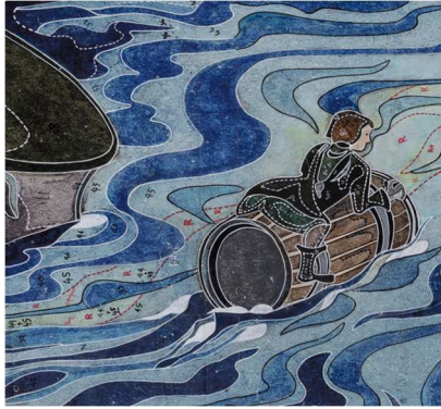
CARTON POUR LA TAPISSERIE BILBO COMES TO THE HUTS OF THE RAFT-ELVES

Cette aventure de presque douze ans, durant laquelle plusieurs ateliers d'Aubusson ont tissé une interprétation textile de 16 illustrations originales de J.R.R. Tolkien (1892-1973), a donné naissance à une tenture de 160m 2 composée de quatorze tapisseries et deux tapis.