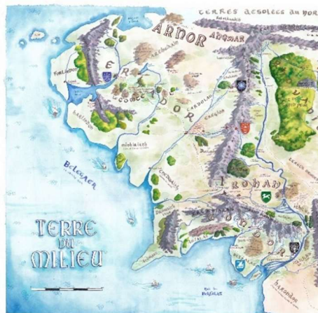
DETAIL, CARTE DE LA TERRE DU MILIEU, VALENTIN PASQUIER, 2025

D'APRES UNE ILLUSTRATION ORIGINALE DE J. R. R. TOLKIEN POUR THE HOBBIT, 1937 © THE TOLKIEN ESTATE LIMITED 1937 ; TISSAGE ATELIER FRANÇOISE VERNAUDON, NOUZERINES COLLECTION DE LA CITE INTERNATIONALE DE LA TAPISSERIE, AUBUSSON