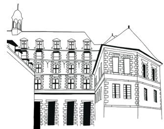
MUSÉE DES BEAUX-ARTS

Pour chaque réservation, il est possible de demander un laissez-passer nominatif afin de préparer sa visite (durée de validité en fonction du projet).