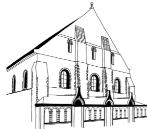
MUSÉE JEAN-LURÇAT ET DE LA TAPISSERIE CONTEMPORAINE

Les animateurs conçoivent leur propre visite pour les enfants ou peuvent utiliser les livrets-jeu mis à disposition gratuitement.